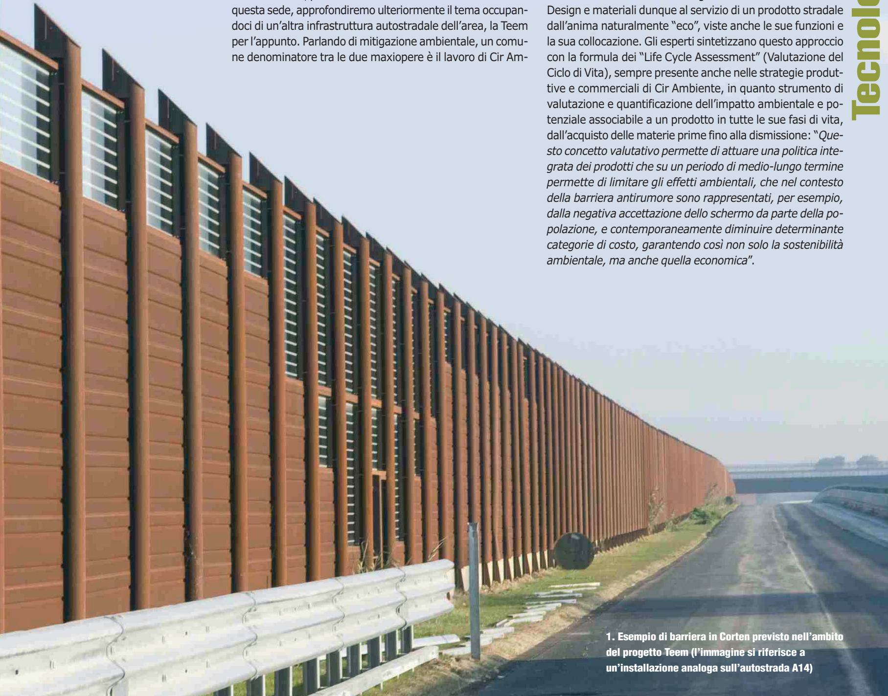
1. Esempio di barriera in Corten previsto nell'ambito del progetto Teem (l'immagine si riferisce a un'installazione analoga sull'autostrada A14)

Design e materiali dunque al servizio di un prodotto stradale dall'anima naturalmente "eco", viste anche le sue funzioni e la sua collocazione. Gli esperti sintetizzano questo approccio con la formula dei "Life Cycle Assessment" (Valutazione del Ciclo di Vita), sempre presente anche nelle strategie produttive e commerciali di Cir Ambiente, in quanto strumento di valutazione e quantificazione dell'impatto ambientale e potenziale associabile a un prodotto in tutte le sue fasi di vita, dall'acquisto delle materie prime fino alla dismissione: "Questo concetto valutativo permette di attuare una politica integrata dei prodotti che su un periodo di medio-lungo termine permette di limitare gli effetti ambientali, che nel contesto della barriera antirumore sono rappresentati, per esempio, dalla negativa accettazione dello schermo da parte della popolazione, e contemporaneamente diminuire determinante categorie di costo, garantendo così non solo la sostenibilità ambientale, ma anche quella economica" .